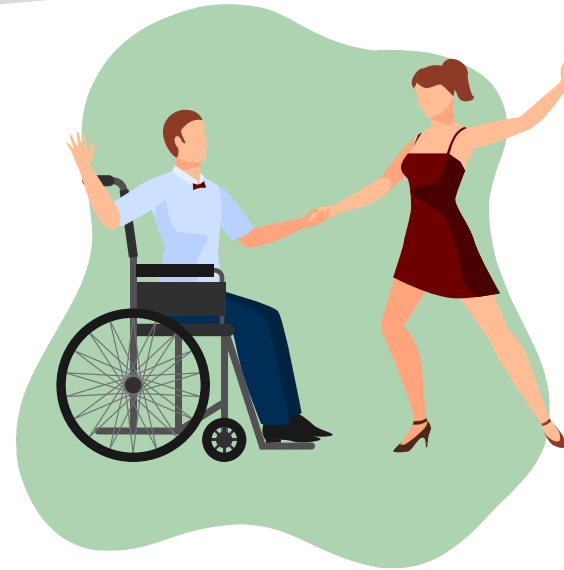
Se préparer à être parents