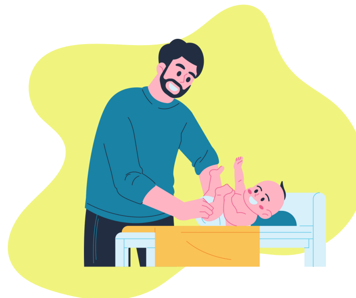
Le retour à domicile