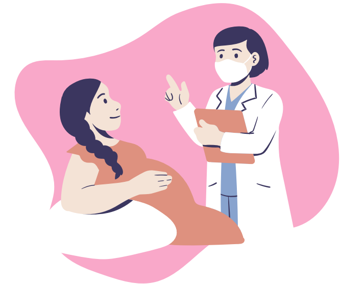
Le temps de la grossesse