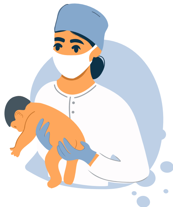
Le temps de la naissance