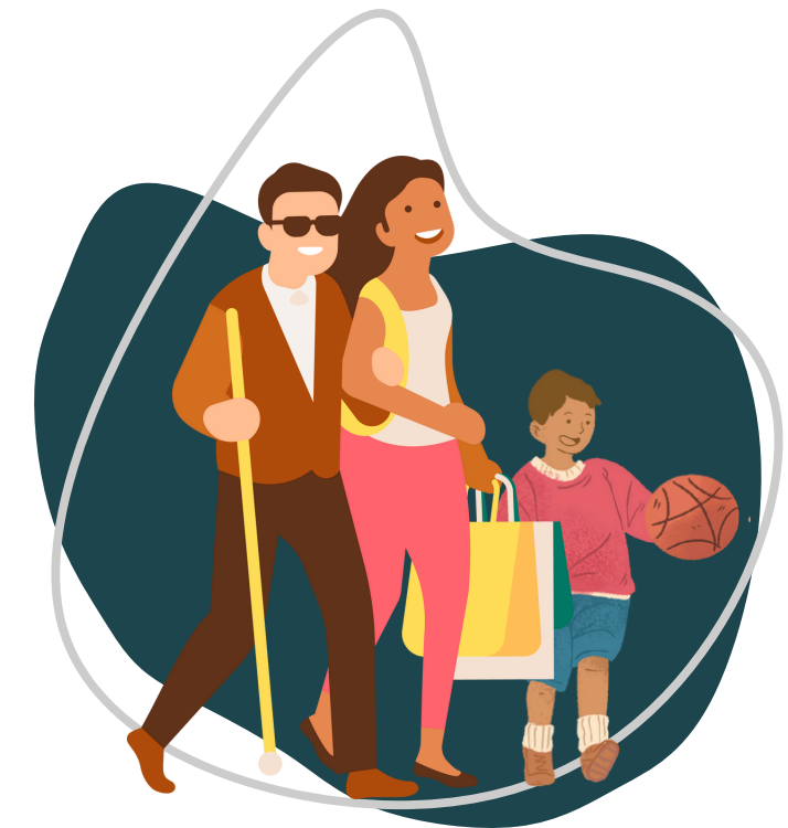
...et jusqu'aux 18 ans de l'enfant