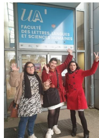
Parmi leurs actions citoyennes, la présentation de l'UPP dans le cadre du DU Accompagnement à la Parentalité à l'Université d'Angers – Décembre 2025