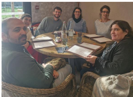
Journée de travail dédiée à l'écriture de l'ouvrage – Janvier 2026

Cette recherche est un outil de légitimation des savoirs des parents pour leur permettre d'aller rencontrer les institutions et de croiser les regards avec eux : Importance du pouvoir de DIRE et du pouvoir d'AGIR des parents dans cette démarche. Les résultats de cette recherche seront écrits dans un ouvrage d'ici cet été et seront suivi de présentation publique de leurs travaux.