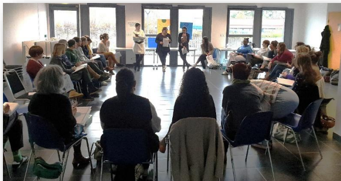
Présentation de leur démarche dans le groupe départemental écoles et familles co-animé par le Réseau Parentalité 49 et l'Education Nationale –Novembre 2025